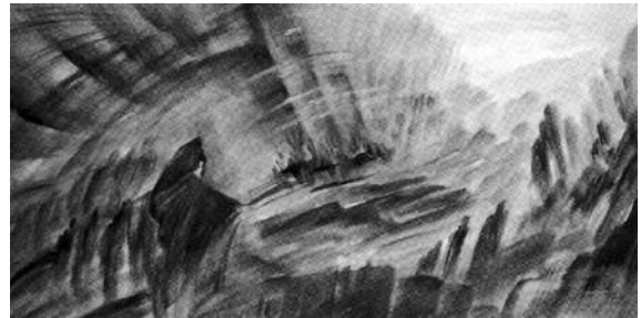
Doris Harpers: Uranus. Aus dem Studium über den Charakter der Planeten

Eine halbe Stunde Fußweg, und wir sind im Anthroposophischen Zentrum